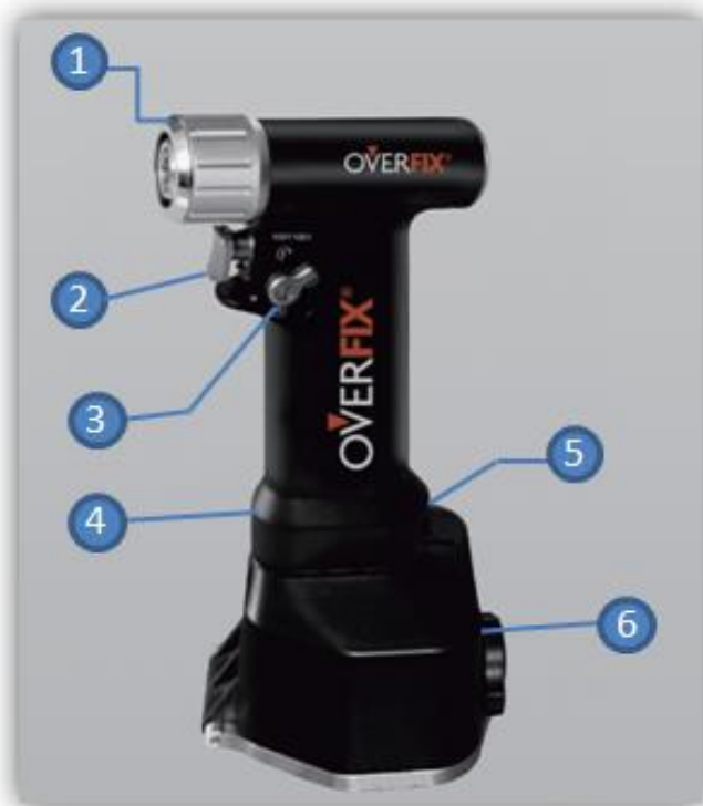
Tabla 1. Partes de la pieza de mano modular.