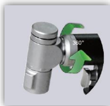
Cabeza giratoria 360°