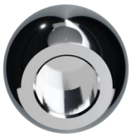
→ Cabeza Modular Ø28