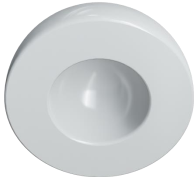
→ Inserto (Polietileno)